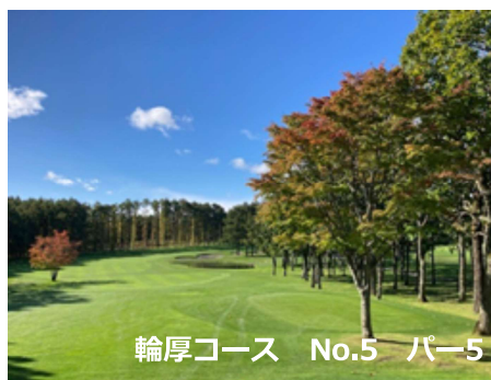
輪厚コース No.5 パー5