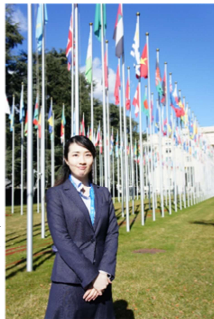
国連ジュネーブ本部にて

臆気に留学を意識していた頃から、国際ロータリーの奨学生に出会う機会が多く、また、その誰もが志高く、教育や平和構築等の自身の専門分野で国際社会及び地域社会への貢献を目指す魅力的な方々であり、彼らのような人々と一緒に活動がしたいと感じていた。また、高校卒業以降、地元を離れており、地域の地域社会への貢献思いと相まって、当該地区の奨学生へ応募させていただいた。今後は当該地区活動にも、積極的に参加させていただければ幸いである。