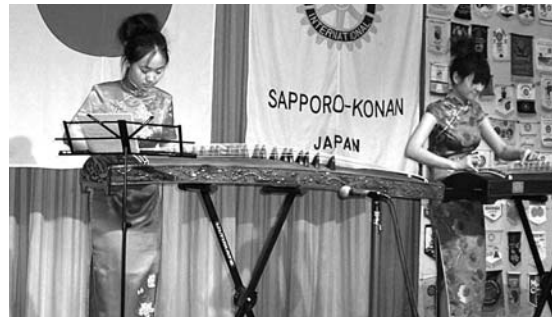
市内留学生を招き国際親善・交流会