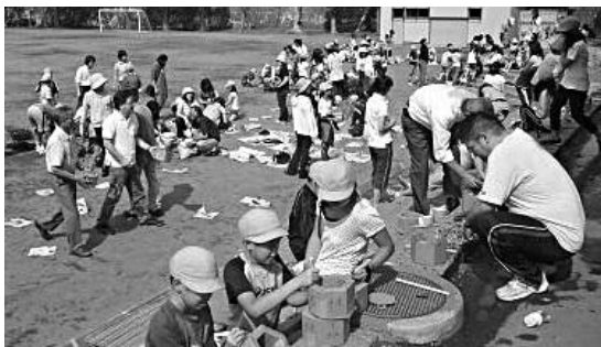
カミネッコン植樹する子供たち

社会奉仕事業「カミネッコン植樹」で小学生たちに植樹する事の大切さを伝え、植樹する子どもたちを育てたい。