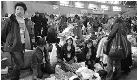
ロータリアンの協力でRACフリマ参加

提唱している札幌南RACが全国RA研究会に参加報告会で長崎料理の試食会、ロータリアンの協力でフリマに出店、国際親善交流会で市内留学生が国際色豊かに伝統芸能を披露。