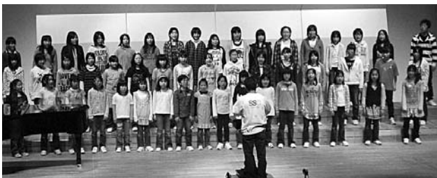
苫小牧RC・苫小牧東RC協働少年少女合唱祭

苫小牧RC・苫小牧東RC協働で苫小牧少年少女合唱団を設立、未来の文化を担う「新世代のための音楽プログラム委員会」を8年前に設立しています。苫小牧市の協力で「ゴミゼロの街苫小牧」の環境活動を実施。