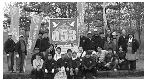
苫小牧東RCゴミゼロ作戦