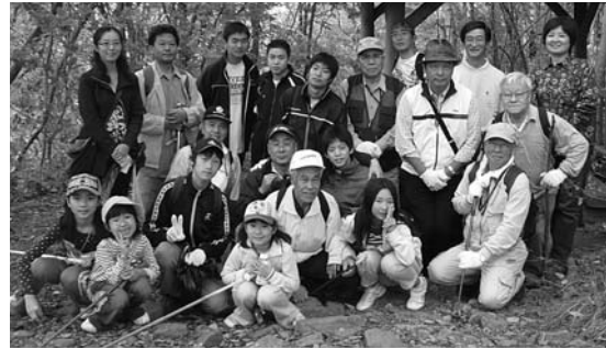
インターアクターと共に三角山ゴミ拾い