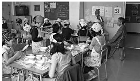
子供たちと共に給食をごちそうになる