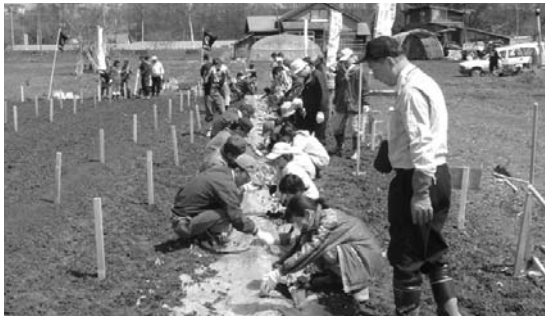
子ども家族とともに体験農場植付け

次世代を託すべき新世代へのアプローチは幼い頃から始める事と認識し、「我が街 砂川」「ふるさと砂川」への思いを持ち未来の担い手となるような機会づくりを目指して、「笑顔」「喜び」「楽しく」を目標に委員会づくり。