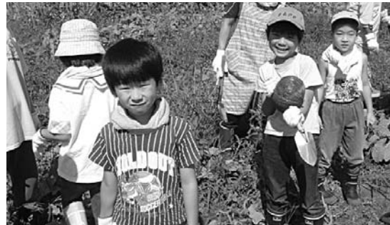
体験農場収穫祭「笑顔・笑い」