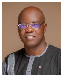
国際ロータリー会長 オラインカ・ ハキーム・ノババラ