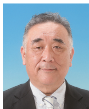
第9グループ ガバナー補佐

2002年に入会し、あっという間に24年が経ちました。毎年その都度与えられた職責をこなすだけで精一杯であり、ガバナー補佐としての知見は不足していると思っております。