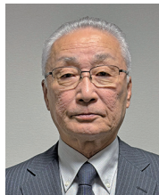
第7グループ ガバナー補佐