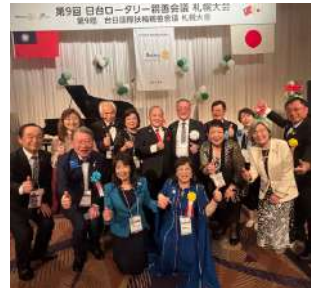
第9回 日台ロータリー親善会議 札幌大会

6月は「親睦活動月間」です。ロータリーの原点である友情と相互理解の大切さをあらためて見つめ直すこの月を迎えようとする5月31日、私たちは第9回日台ロータリー親善会議を北海道・札幌にて開催いたしました。本会議には、台湾・日本各地から約800名ものロータリアンが集い、言葉や文化を超えた温かい交流のひとつときを共にしました。歓迎レセプションでは、各クラブのバナー交換や若手ローターアクターの積極的な参加により、会場は華やかな雰囲気にもまれ、友情の輪が着実に広がっていく様子が感じられました。