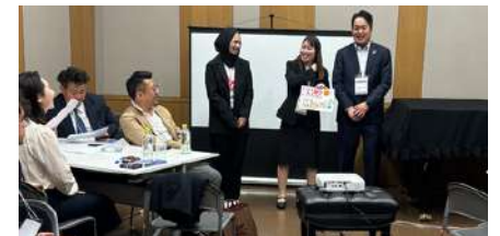
「平和について」一人一人が何ができるか