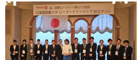
北海道医療大学RAC設立ナイト