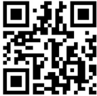
北海道ローターアクト交流会 プログラム・記念誌