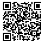
ロータリー財団 2024-25年度 8月末 地区別寄付報告 (単位:米ドル)