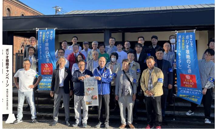
「きらら共和国独立建国祭」ポリオ根絶募金活動 蘭越ロータリークラブ10/6(日)