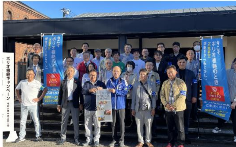
道の駅「ウトナイ」 苫小牧東ロータリークラブ10月26日(土)