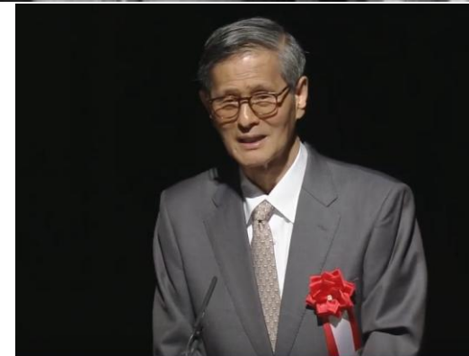
WHO西太平洋事務局名誉事務局長 尾身 茂 先生