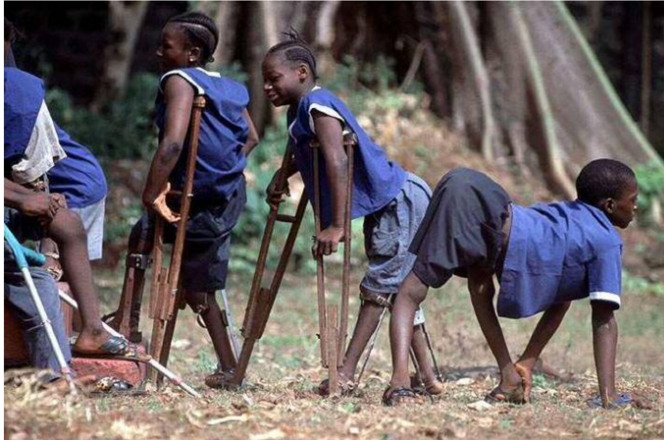
ポリオに感染した子供たち