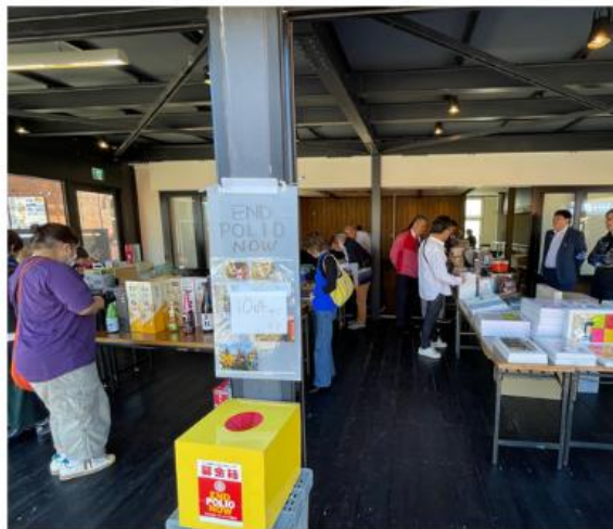
「きらら共和国独立建国祭」ポリオ根絶募金活動 蘭越ロータリークラブ10/6(日)