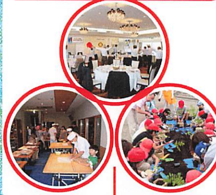
関連するスナップ写真

通常例会は朝ですが、夜間にも行うことがあります。その際はお酒なども楽しみながら親睦を深めたり、インターアクトクラブの活動発表を聞いたりします。年末恒例の家族会を楽しんでいる子供たちも多く、アトラクションやクリスマスプレゼントが人気です。