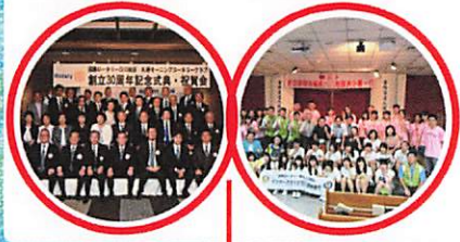
関連するスナップ写真

5) 青少年奉仕 当クラブは1992年より継続してインターアクトという高校生のボランティア活動の支援を行っています。また、高校生の相互海外留学を支援する青少年交換事業、更に、海外留学生を支援する米山奨学金支援事業なども積極的に行っています。