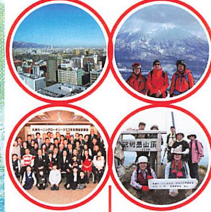
関連するスナップ写真