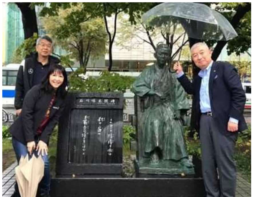
【国際ロータリー第3490地区のオルソーPDGとヤン奥様と共に】