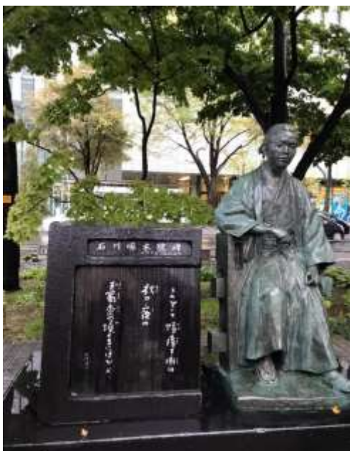
【札幌市大通西2丁目にある啄木の像】

丁度9月に2週間ほど札幌に滞在した。この歌はその時に詠まれたものだ。私の父は大の玉蜀黍好きで見事に軸から外して食べている姿を今に思い起こす。父が生まれて1歳当時の出来事のような。(羽部記)