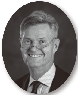
国際ロータリー会長 ホルガー・クナーク