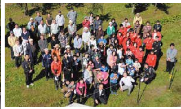
●滝川RC (消防署・消防団へ車両寄贈)