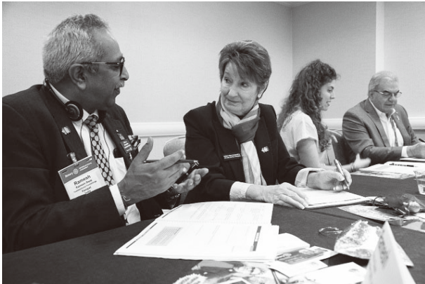
国際協議会でのディスカッションの様子