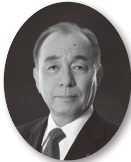
ガバナー 福井 敬悟