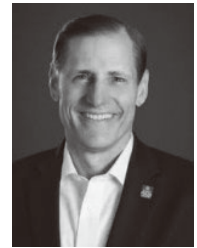
RRFC Dainin Habu 様

ロータリー財団が毎日、世界中の人びとを支えることができるのは、持続可能な変化を生み出すことへの皆さまの熱意のおかげです。温かいご支援により、ロータリー財団は今年度も、より大きなインパクトを生み出しつづけています。この度、模範となるご支援をおロータリー財団が毎日、世界中の