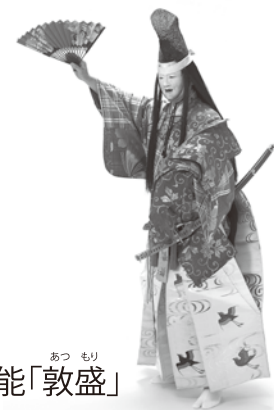
あつ もり 能「敦盛」