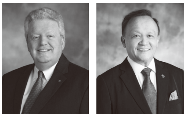
マローニー会長とゲイリー財団管理委員長

私たちは厳しい時代に生きています。お互いに支えることができない場合、どれほど困難になるかを想像してみましょう。心を強く豊かにするグローバルな友情、奉仕プロジェクト、つながりがなかったら、果たしてどうなるかを想像してみましょう。ロータリーがなければ、私たちの生活に同じような活力と目的は見出せなかったでしょう。ロータリーを通じて、世界中そして自分自身の中で変化が生まれることを私たちは知っています。私たちが共につながり、行動するのはそのためです。