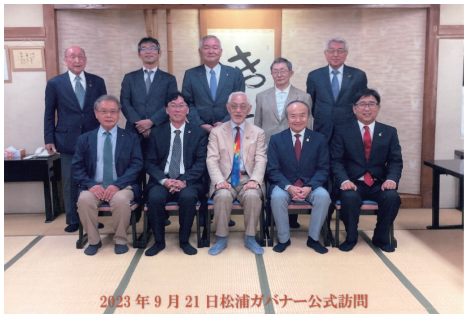
2023年9月21日松浦ガバナー公式訪問

19:30 夜間例会場「丸金旅館」で懇親会。みんなで和やかに親睦を深め、記念撮影。松浦ガバナーご一行の皆様、公式訪問誠にありがとうございました。