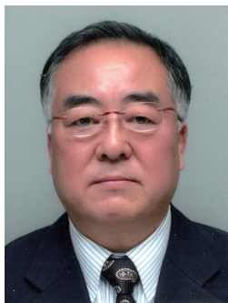
RI国際大会推進委員会（PG）