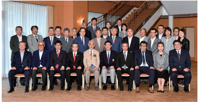
2023-2024年度 小樽ロータリークラブ「ガバナー公式訪問」令和5年9月5日 グランドパーク小樽