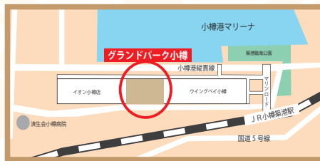
グランドパーク小樽