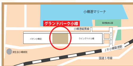
グランドパーク小樽