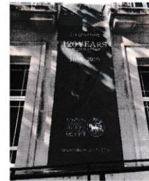
写真 1 LSHTM 120周年

9月最終週は、Introduction Weekとして、学生同士の交流やプログラム内容の説明が中心でした。10月以降の月例報告では、大学院でのプログラムの内容の詳細や、ロンドンのロータリークラブでの交流行事、また、現在住んでいる寮などについて、順にご報告いたします。