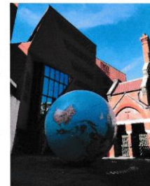
写真 2 LSE Globe