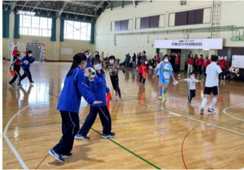
楽しくウォーミングアップ