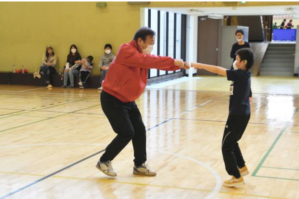
井上会長エレクトと子ども達の交流