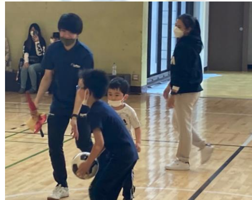
留学生も一緒に参加

「 主役は参加者全員 」。 開会式で簡単な手話講座を受け、 フットサル教室やスポーツ交流 では耳栓をして聞こえない世界を 体験。 ロータリアン含め、みんなが体を 動かしながら交流を深めました。