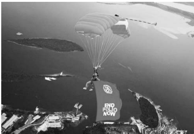
ブラジルの観光地イグアスの滝やアマゾン川上空で「End Polio Now」