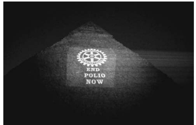
エジプトのピラミッド