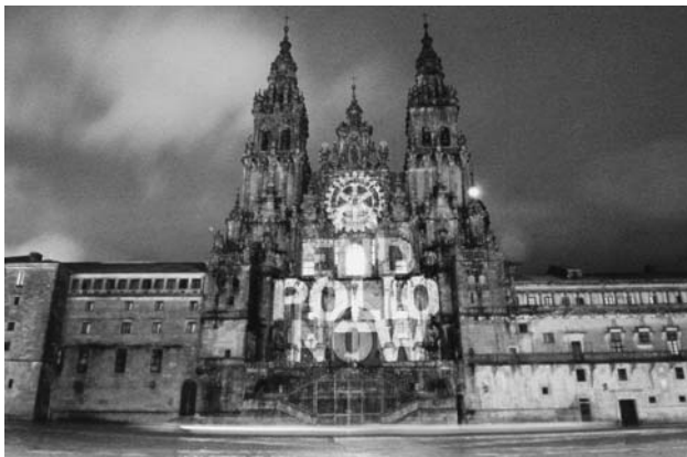
スペインのサンチアゴ大聖堂

こういった催しが日本で報道されることはほとんどありませんので、日本の皆さんにはなじみが薄いかもしれませんが、昨年はビッグベンで知られるロンドンの国会議事堂やシドニーの音楽堂など、そして、今年の誕生日には、スペインの有名な大聖堂の正面に「End Polio Now」のメッセージが浮かび上がりました。もし、日本で奈良・東大寺の大仏殿やお寺の五重塔でこのようなことをしたら「景観条例」などに抵触したり、人々の鬱鬱(ヒツツク)を買うことになるかもしれませんが、なんと、エジプトのロータリーは、今年の2月23日にピラミッドに大きなロータリー・ロゴと「End Polio Now」の文字を浮かび上がらせました。ただ、日本でもできそうな行事の参考として、フィリピンのマニラから送られてきた写真には、繁華街での大きなバルーンが写っていますし、ブラジルでは、アルゼンチンとの国境にあるイグアスの滝に横断幕を掲げ、その前で地元テレビ局のインタビューを受けたり、アマゾナス州の首都マナウスでは、派手な「End Polio Now」の旗をつけたパラグライダーがアマゾン川上空を舞うというイベントを繰り広げたりしています。ちなみに、こういった行事は日本ではまだ行われたことがないので、来年度の広報補助金プロジェクトの一つとして企画してご覧になってはいかがでしょうか。