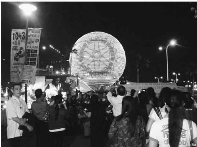
フィリピン・マニラの繁華街にバルーン登場