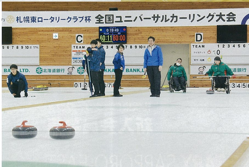
THE ROTARY CLUB OF SAPPORO-EAST