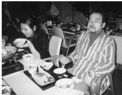
お前ら、いい加減にせーよ【赤裏】