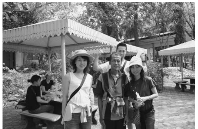
患者さんと記念撮影