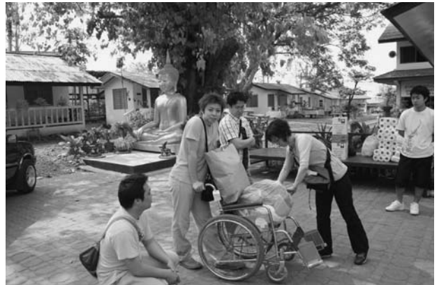
日本から持ってきた車いすと古着を寄贈しました。

赤平RAC 3名、札幌北RAC 2名、岩内RAC 2名、千歳RAC 2名、室蘭北RAC 1名、岩見沢RAC 1名 合計13名