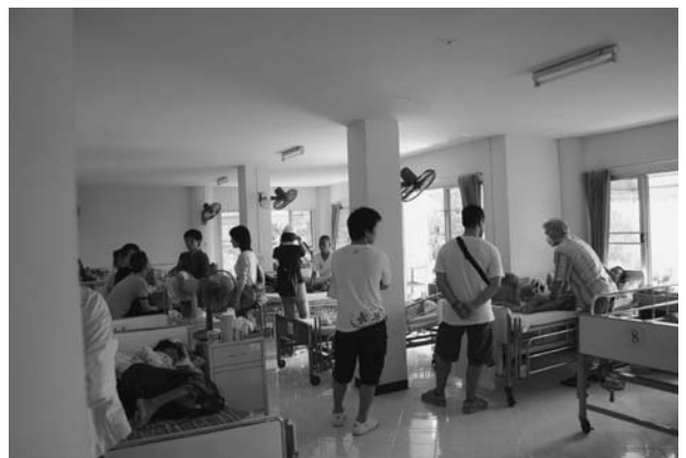
中度病棟。ボランティアの方がマッサージをしています。