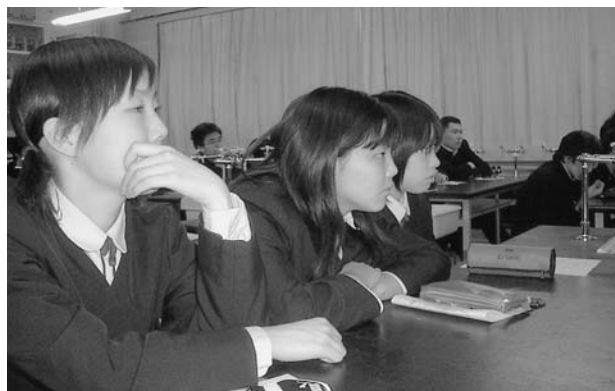
会員による授業風景 (04年2月5日、札幌市立北辰中学校3年1組の教室にて)