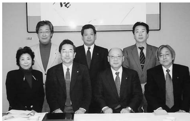
第2回委員会 (03年12月13日、ホテルライフオートにて)