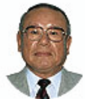
2003-2004年度 国際ロータリー第2510地区 地区大会実行委員長

又、遠距離からの参加を考慮し、本会議の終了は15時ごろを考えています。登録料も最低限で抑えました。多くの会員の参加を願っています。