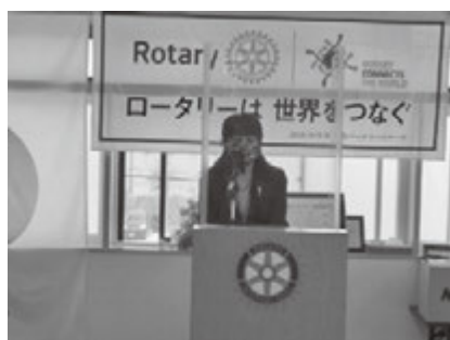
例会場に消毒液やマスクを常備。演壇やテーブルにアクリル板を設置