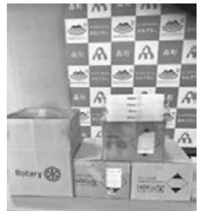
寄贈したロータリーマーク付きのフェイスシールド