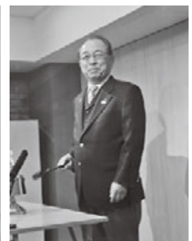
福井敬悟ガバナーエレクト