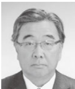
第12グループガバナー補佐