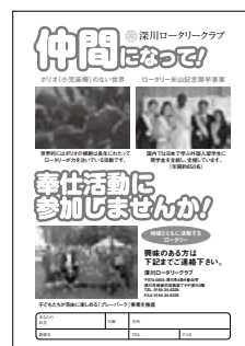
左：表紙 右：会員勧誘チラシ例