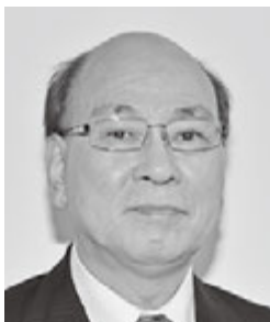
第9グループガバナー補佐