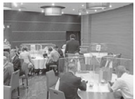
懇親会を通じ50年を振り返る