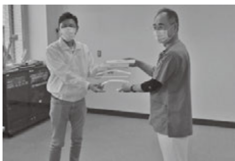
北海道立羽幌病院に贈呈