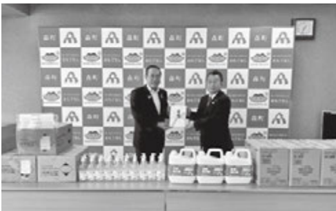
6月22日 贈呈式 左：梶谷恵造森町長

6月22日、島野裕司会長らが森町役場を訪問し、梶谷恵造町長に上記3品目の贈呈式を行いました。子育て支援課より各施設に配布、大変喜んでおりましたとの報告があり、加えてロータリーマーク付きのフェイスシールドで認知度向上に寄与できたと思います。