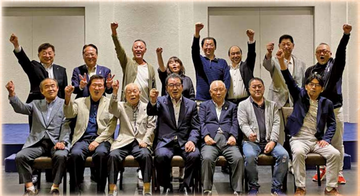
地区幹事お疲れ様会