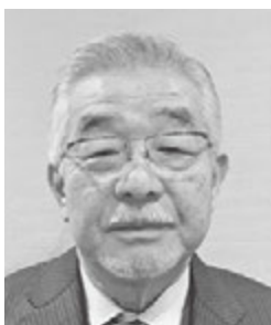
第11グループガバナー補佐