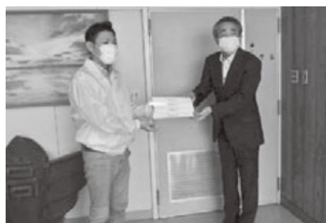
北海道羽幌高等学校に贈呈