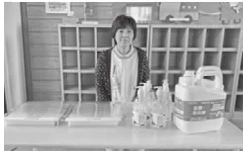
森町立尾白内保育所に消毒液など寄贈