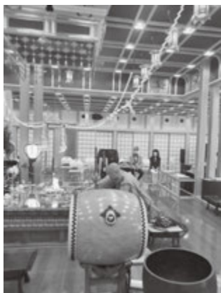
会員寺院で終息祈願