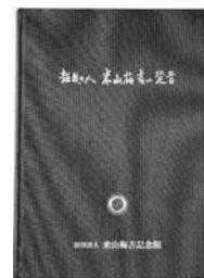
B5判 記念館35周年記念誌 本文268ページ/2,500円