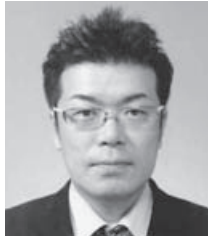
留萌RC 森 将由生 8月5日入会 飲食業