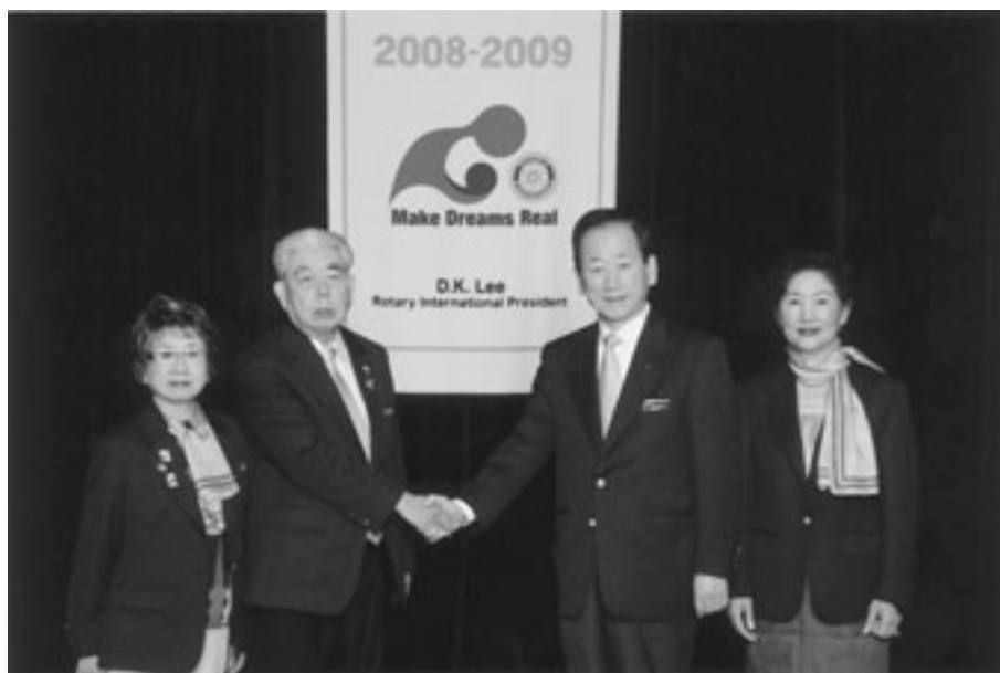
RI国際協議会(カルフォルニア、サンディエゴ)にて