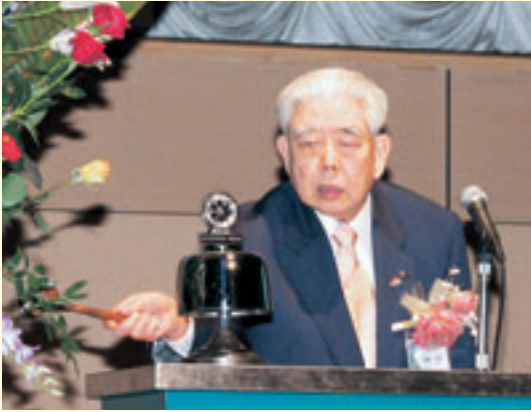
矢橋ガバナー点鐘