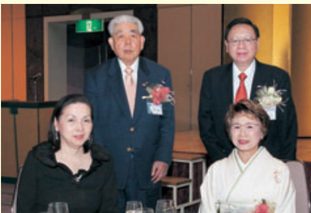
RI会長代理・ガバナーご夫妻