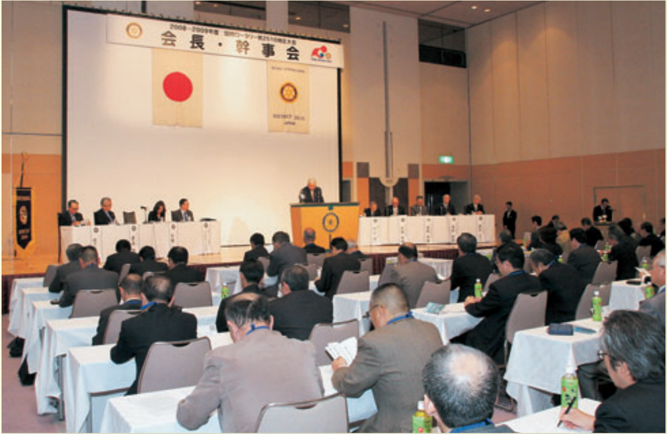
大会第1日 会長・幹事会