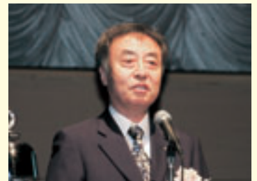
八木大会実行委員長