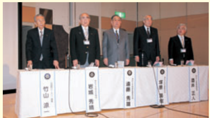
地区パストガバナー