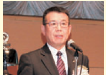
石谷ホストクラブ会長