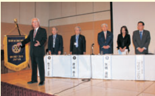
ロータリーソング斉唱