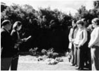
ミーガンの墓前で留学課程修了証書を読みあげる清水地区青少年交換委員長

道路から見える住宅はどこも庭の芝がきれいに刈られ、すっきりとした印象を与えます。あちこちの庭で、上半身裸で芝刈りに精を出す男性の姿が見受けられました。庭の芝刈りは義務づけられていて、怠ると市が代行する代わりに高い料金を取られるので、日曜はどここの家庭も芝刈りに汗を流すとのことでした。