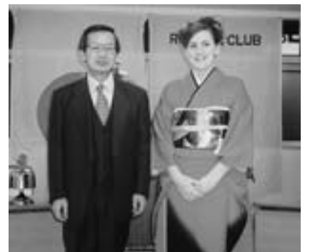
ミーガンは着物も似合った（隣りは筆者）

折角の機会だから、千歳や恵庭からオーストラリアに来て学校に通っている学生にも声をかけよう、ということになりました。