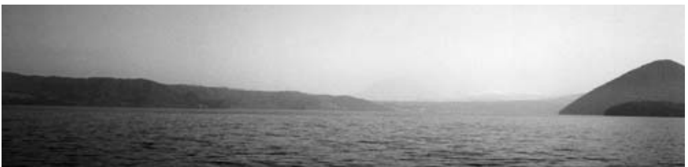
「大人は子どもに何が出来るか」のワークショップの翌朝。ホテル万世閣より見た朝もやにかすむ洞爺湖