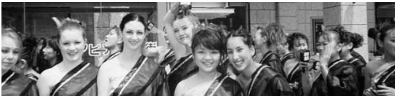
YOSAKOIソーラン祭りにリレント舞華軍団の一員として参加した6人の交換留学生。6月7日(土) JR札幌駅前にて

会員増強は、名案がある訳ではない。私は皆さんへのお願いとして、会員増強の新たな方向は30代の若い人の獲得に集中していただくのは如何かと申し上げた。例えば青年会議所の会員の中から勧誘することである。またそれ以前の重要な問題はそのような若い人達に魅力あるロータリー