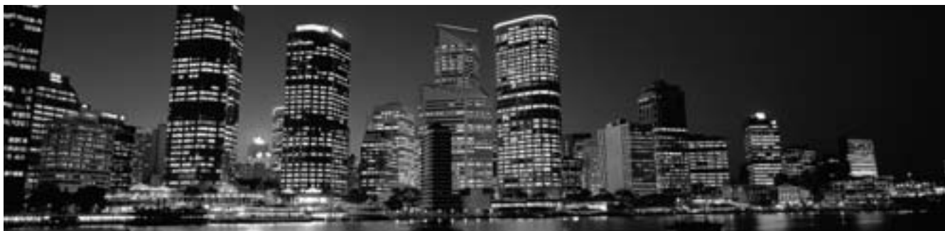
リッジスサウスバンクホテルの12Fからみたブリスベンの夜景が美しかった