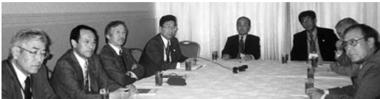
ガバナー補佐座談会、みんな緊張の表情。次第に柔くなって談論風発。