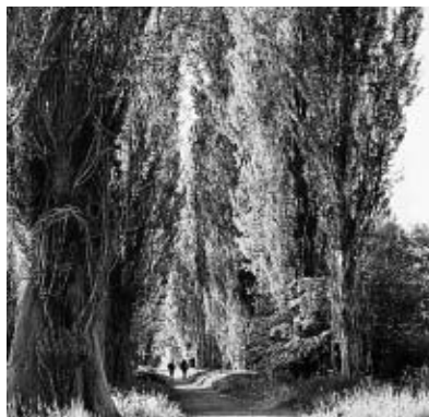
北大構内 ポプラ並木