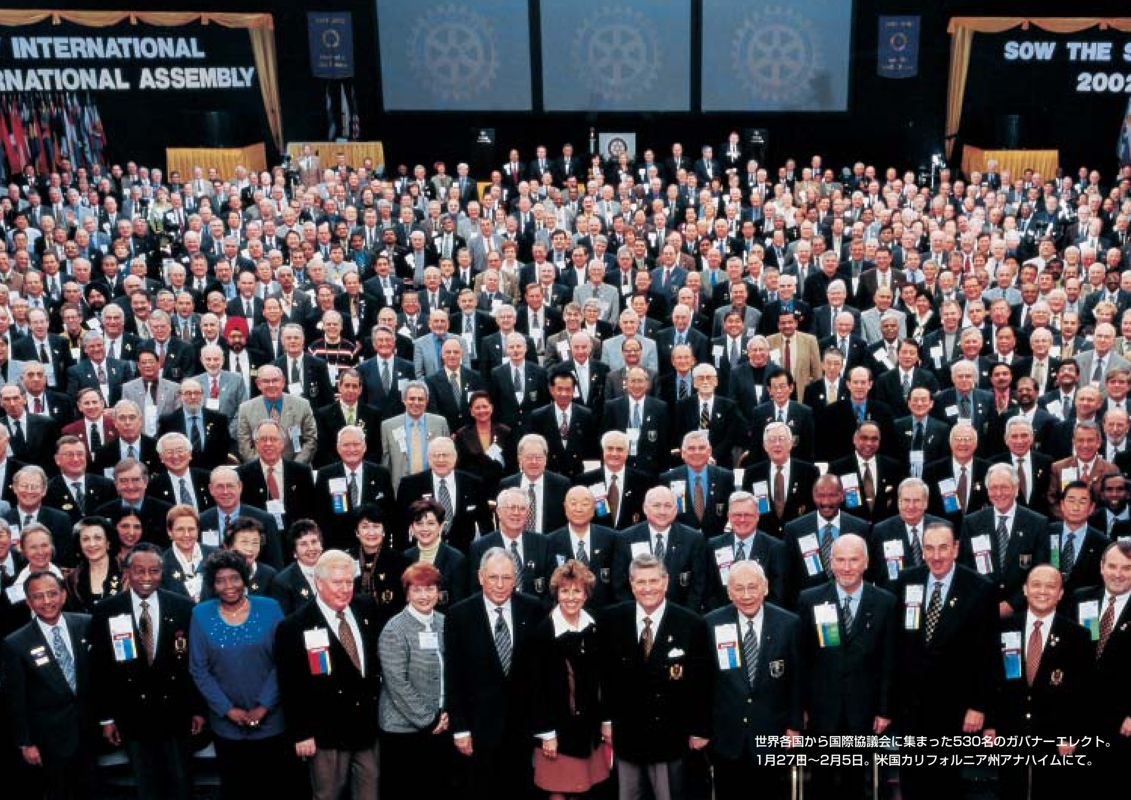
世界各国から国際協議会に集まった530名のガバナーエレクト。 1月27日～2月5日。米国カリフォルニア州アナハイムにて。