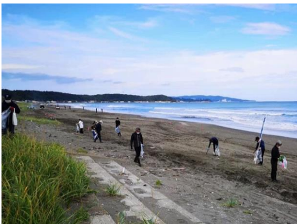
第 2500 地区(北海道)