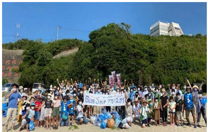
第 2820 地区(茨城県)