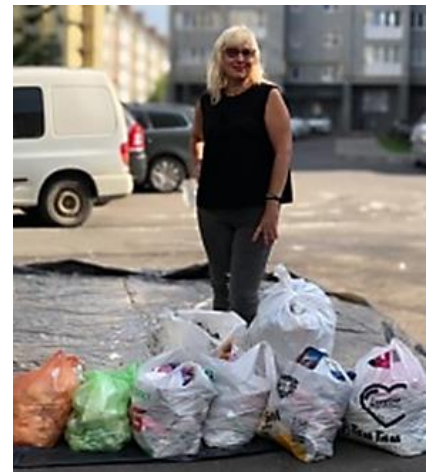
第2232地区(ウクライナ)