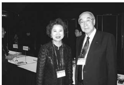
南星姫パストガバナーと一緒に

2011年の日韓親善会議は、東京のディズニーシーで開催されます。日本から1000名を超える参加者が見込まれています。ぜひ第2510地区からも大勢のロータリアンが参加されることを期待しています。