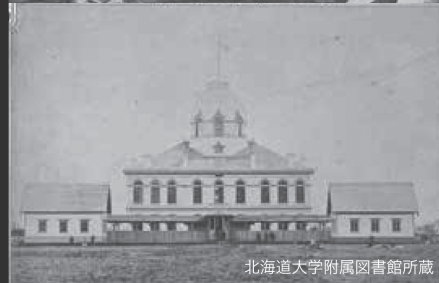
北海道大学附属図書館所蔵