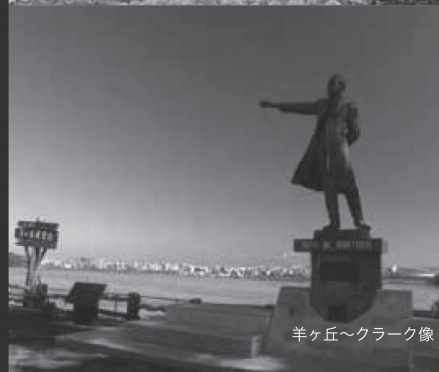
羊ヶ丘〜クラーク像