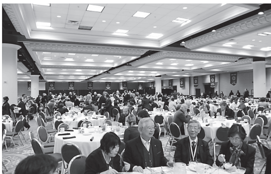
食事風景(毎日三食ここで食べます)