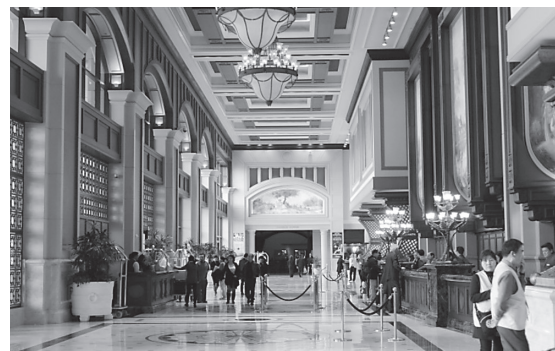
ホテルのエントランスロビー