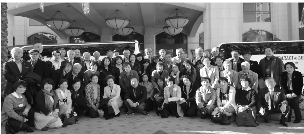
すべてを終えて帰国へ 日本のメンバー全員 ホテルの前で

最後に一緒に同伴してくれました奥様たちの影の力は計り知れないと思いました。同性だけでは最後の日まで続けることは難しかったと思っています。家族の理解と協力を大事にしなければと感じたところです。レディーファーストは帰国してからも続いています。会員の皆様に改めて国際協議会へ参加できたことを感謝いたします。