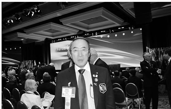
本会議場の舞台を背景に

私自身の会話能力で交流は無理からぬところですが、International Assemblyすなわち国際協議会（国際集会・会合）からすると、とにかく多種多様な人々の集まりであることはよくわかりました。それぞれの国や地域にいても外国の事、人々のことを思いながらロータリーを回してよりよい世界を目指して行こうと心に止めた集会でした。