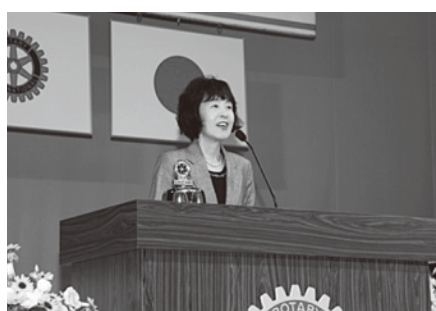
高橋はるみ北海道知事