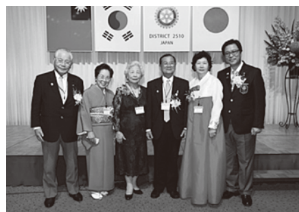
日・台・韓の国際親善