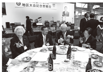
グラスを傾け懇親