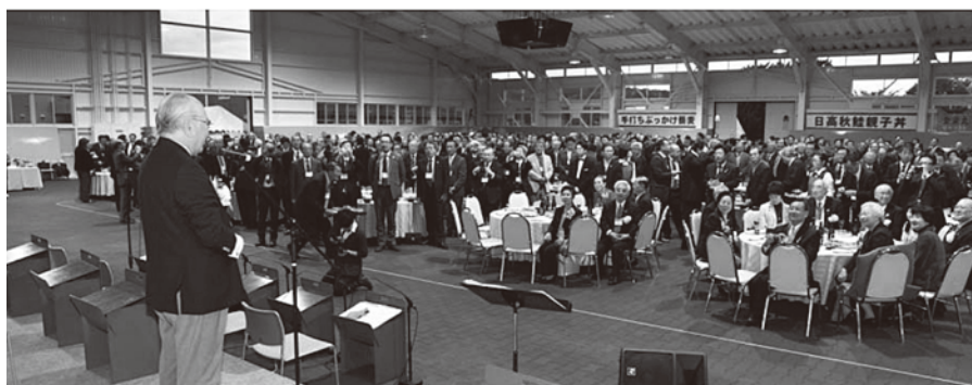
たくさんの参加者