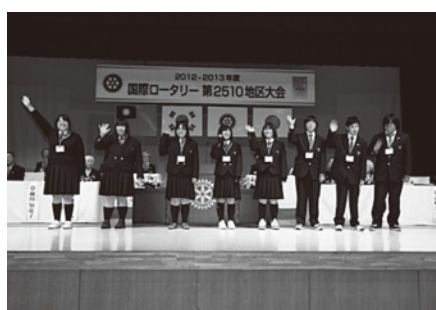
インターアクター