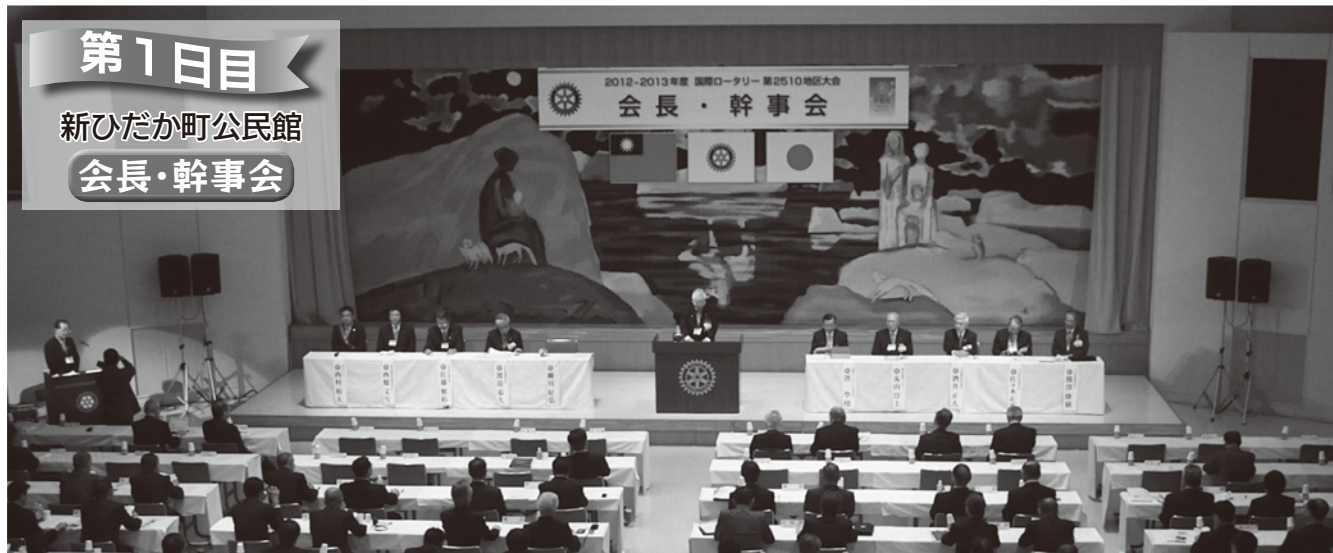
開 会 式