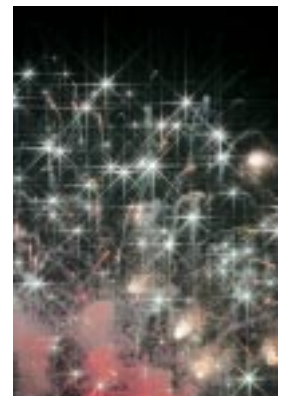
表紙：札幌豊平川花火大会

ROTARY INTERNATIONAL DISTRICT 2510 2008～2009 GOVERNOR'S MONTHLY LETTER