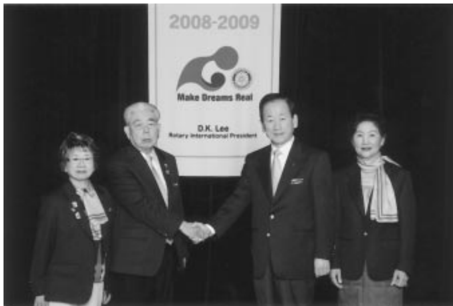
RI国際協議会(カルフォルニア、サンディエゴ)にて