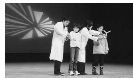
ペーパーブーメラン