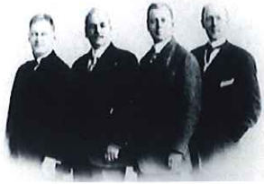
ロータリーのはじめの4人 右端：ポール・ハリス

ロータリーは、1905年当時殺伐としたアメリカ、シカゴの青年弁護士ポール・ハリスにより設立されました。仕事上のつきあいが親友関係にまで発展する仲間を増やしたいとの趣旨から始まり、志を同じくする仲間が集い、新しいクラブが次々と誕生し、現在では国境を越え国際ロータリーとして大きく発展しました。世界に広がるロータリーの輪は、34,000のクラブと120万人ロータリアン(ロータリークラブ会員の通称)で構成されています。世界のロータリアンが、幅広い奉仕活動を行っています。