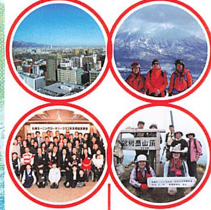
関連するスナップ写真