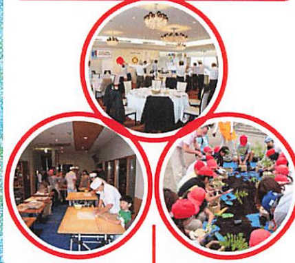
関連するスナップ写真

通常例会は朝ですが、夜間にも行うことがあります。その際はお酒なども楽しみながら親睦を深めたり、インターアクトクラブの活動発表を聞いたりします。年末恒例の家族会を楽しんでいる子供たちも多く、アトラクションやクリスマスプレゼントが人気です。