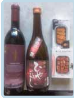
某会員のお土産の一部