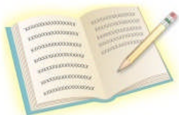
表.されるのかを確認でき、WordPress、Blogger、LiveJournal など、お気に入りのブログ サービス プロバイダーにブログを投稿することもできます。

Windows Live Writer とは、オフラインで投稿を簡単に作成できるソフトです。美しいブログ記事を作成し、ブログに投稿する前にオンラインでどのように