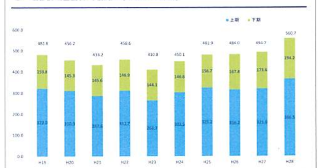
3 観光入込客数の推移 (H20~H28)