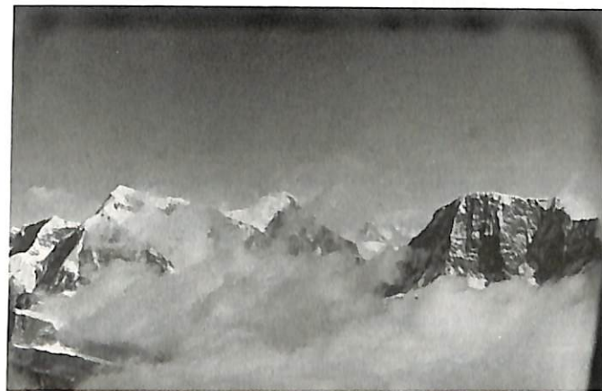
世界最高峰、標高8,848mのエベレスト 59.2.8