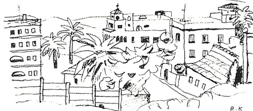
モロッコの玄関 タンジールの町