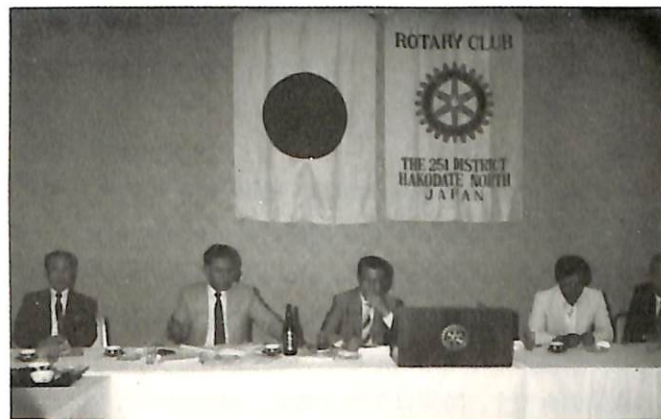
クラブアッセンブリー (国際ホテル) 6月8日