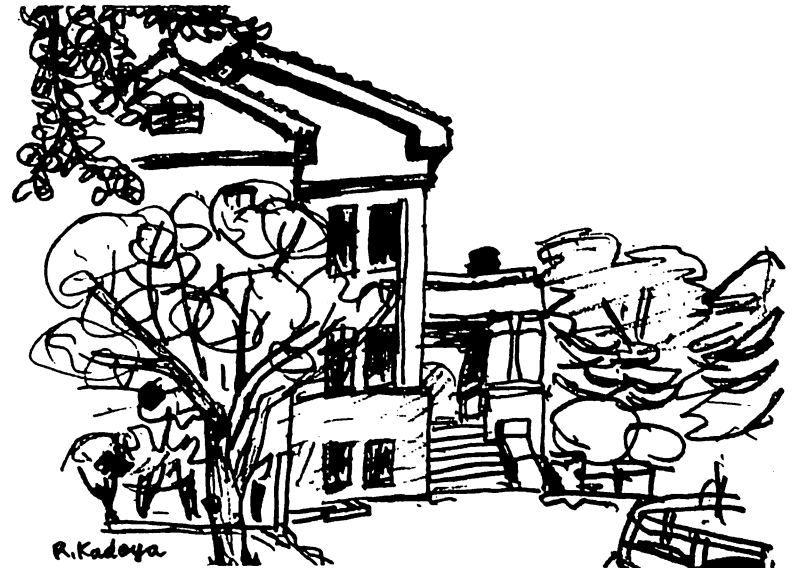
図書館 (函館公園) 角谷隆一会長

例会日 毎週水曜日 12:30~13:30 例会場 国際ホテル 事務所 函館市大手町5-10 日魯ビル 3階 電話 (0138) 23-3870