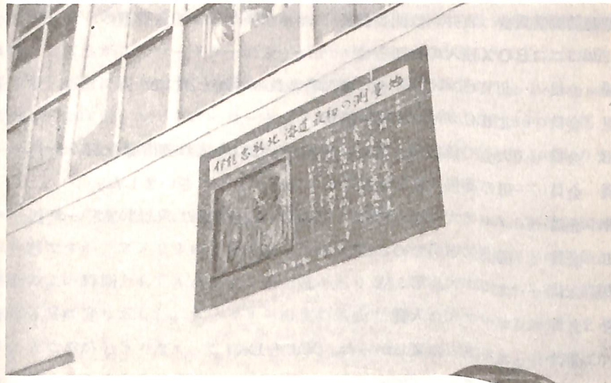
伊能忠敬北海道最初の測量地

例会日 毎週水曜日 12:30~13:30 例会場 国際ホテル 事務所 函館市大手町5-10 日魯ビル 3階 電話(0138)23-3870