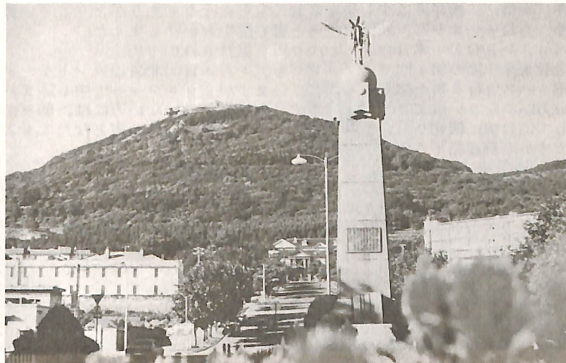
明治天皇行幸記念碑

例会日 毎週水曜日 12:30~13:30 例会場 国際ホテル 事務所 函館市大手町5-10 日魯ビル 3階 電話 (0138) 23-3870