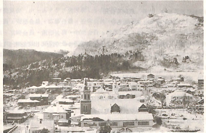
冬 景 色 そのIV

例会日 毎週水曜日 12:30~13:30 例会場 国際ホテル 事務所 函館市大手町5-10 日魯ビル 3階 電話 (0138) 23-3870