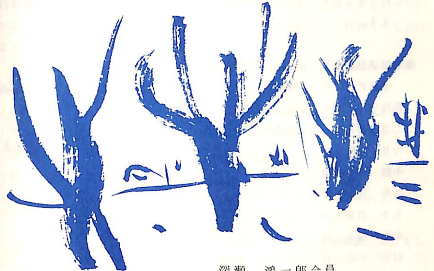
深瀬 鴻一郎 会員

例会日 毎週水曜日 12:30~13:30 例会場 国際ホテル 事務所 函館市大手町5-10 日魯ビル 3階 電話(0138)23-3870