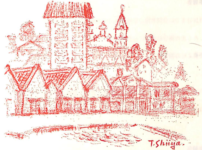
東 浜 界 限