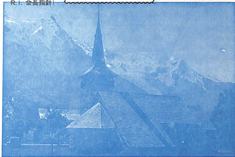
シャモニーよりモンブランを望む