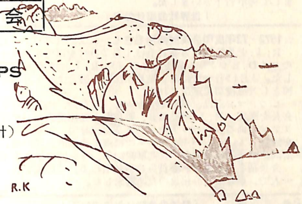
立待岬 角谷隆一 一会員